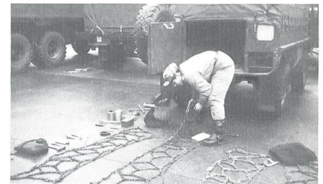
Auch das gehört zur Ausbildung der «Motorwägelers» – Auslegeordnung des Pinzgauer-Zubehörs.

Donnerstag, oh happy day! Eintrittsprüfungen. Erste Probleme schon nach dem Pyjamatürk, ist es TAZ komplett oder TAZ komplutt mit oder ohne Taschenpfunzel. ACDC, ja oder nein? Nachdem wir um 7.01 Uhr auf die Steyr verfrachtet wurden, bemerkten wir schon bald, dass eine Taschenpfunzel «TP» kein «Seich» gewesen wäre. Wir stampften uns die