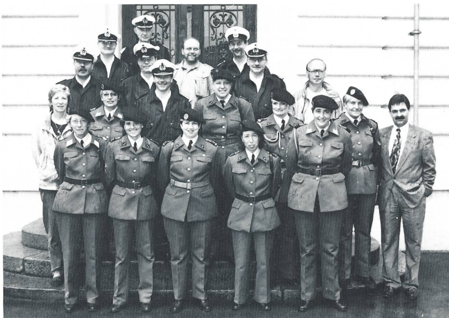
Gruppenbild anlässlich des Besuches in den Konstruktionswerkstätten Thun