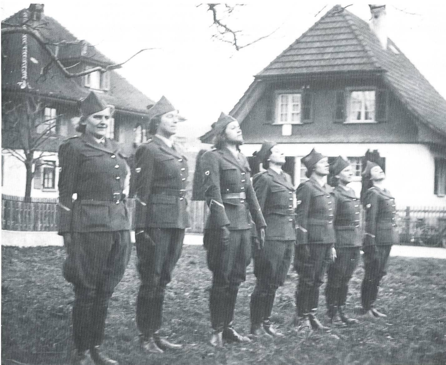
Achtung – Steht!

Sonntag, 21. Januar 1940: Ich schlitte mit den Buben am Schönenbühli.