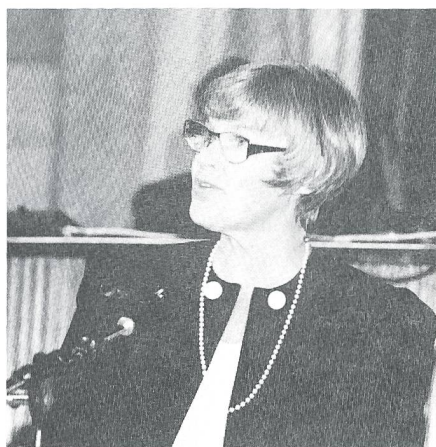
Bild aus «Info letter from the Assembly of Western European Union».

● Zum EU-Beitritt (mit Abstimmung am 16. Oktober 1994): Die EU-Mitgliedschaft würde unsere Sicherheit in der Weise verbessern, dass diese uns eine direkte Einflussmöglichkeit auf diejenigen Beschlüsse einräumen würde, die bei den Ministerkonferenzen der EU im Hinblick auf die Sicherheit in ganz Europa gefasst werden. Vom sicherheitspolitischen Standpunkt würde unsere mögliche EU-Mitgliedschaft in erster Linie bedeuten,