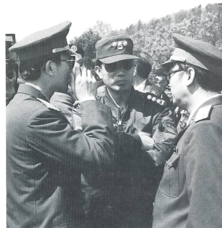
Gäste und Beobachter waren auch die Militärattachés verschiedener Staaten.

Nachdem die fiktiven Überflugsbewilligungen von Österreich und Tschechien erteilt waren, traf am Freitag, spät in der Nacht, aus Klotten eine kleine Rekognoszierungs-Mannschaft, bestehend aus Suchhunden mit ihren Führern, Spezialisten und Arzt, am Übungsplatz in Wangen a/A ein. Am Samstag wurden weitere aufgebotene Rettungsmannschaften ins «Trümmendorf» gebracht. Diese waren alle mit Verpflegung für 3 Tage und Zelten zum Schlafen ausgerüstet. An den beiden für Brünn simulierten Schadenplätzen in Wangen an der Aare und Grenchen waren gegen 100 Personen mit ca 20 Hunden und 15 Tonnen Material im Rettungseinsatz. In Wangen a/A wurde nach dem Anflug mit Helikoptern die Rettung von Menschen (Hundeführer) geübt, während in Grenchen eine Trinkwasserfassung und Notbehausungen erstellt wurden. Die Suche mit den Hunden nach Verschütteten und das Ausgraben durch Spezialisten wurde eindrucksvoll demonstriert. Wenn man bedenkt, dass im Ernstfall noch gegen den Leichengeruch angekämpft werden muss, kann man diese Retter nur bewundern. Auch die Arbeit der Strahlenfachmänner auf mögliche Quellen radioaktiver Belastung ist von grosser Bedeutung.