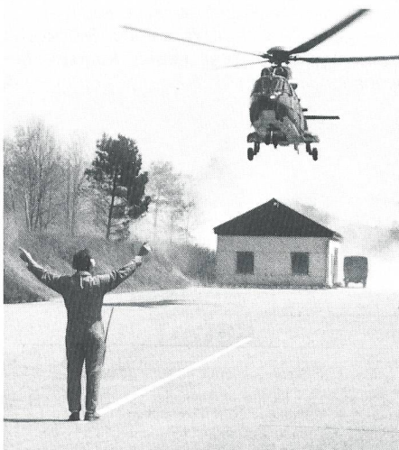
Landung des ersten Transporthelikopters «SUPER-PUMA» im fiktiven «Brünn».

Helfern und Material entscheidend. Die persönlichen Ausrüstungen der Rettungsdetachements und das leichte Korpsmaterial wie Ärztekisten, kleinere Zelte usw sind in Baracken auf dem Flughafengelände Zürich eingelagert. Das schwere Material liegt dagegen an einem andern Ort in der Nähe von Bern.