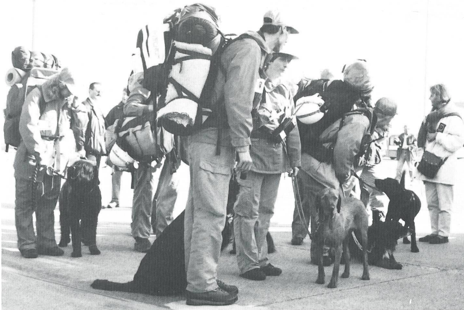
Die Hundeführer warten mit ihren Suchhunden auf den Verlad in die Transportheil.