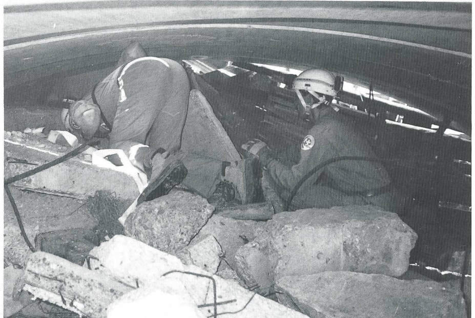
Die Rettungsspezialisten suchen nach Verschütteten. Sie übernehmen alsdann die mühsame Arbeit, die Trümmer freizumachen, um den eingeschlossenen Menschen Hilfe zu bringen. Eine harte Arbeit.

Schon wenige Stunden nach dem Entscheid zur Hilfeleistung wurden die beteiligten Rettungsketten-Organisationen per Telefon alarmiert. So der Flughafen Zürich, die Swissair, das SKH, die Hundevereinigungen SVKA, die Sanität, die Luftschutztruppen, die REGA und der Erdbebendienst. Ein Rekognoszierungs- team flog schon am Freitagabend mit einem Helikopter an den Ort des Grauens. Die umgehend von diesem Team erhaltenen Meldungen waren für die erste Bereitstellung von