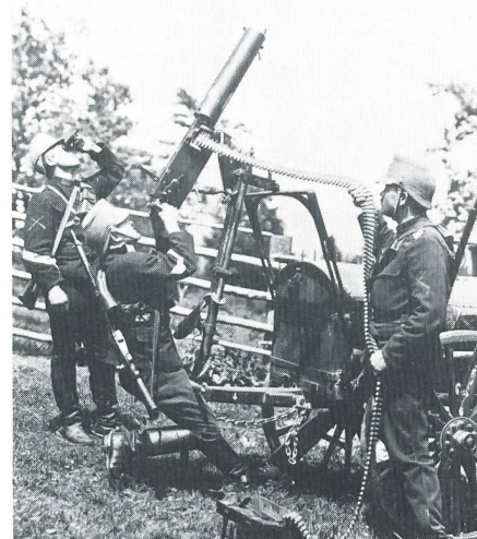
MG Modell 1900 in Flabstellung