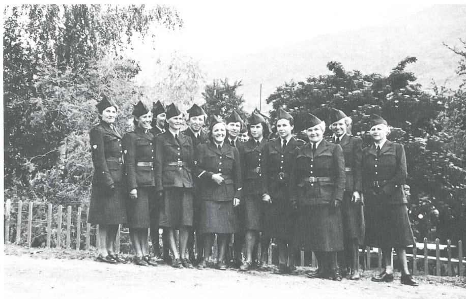
Die Kolonne 11

Montag, 20. Mai 1940: Unser «Wachmeislerli», wie wir es liebevoll zu nennen pflegen, hat eine weitere Übung geplant, diesmal nach Saas-Grund. Sonne, gleissende Gletscher,