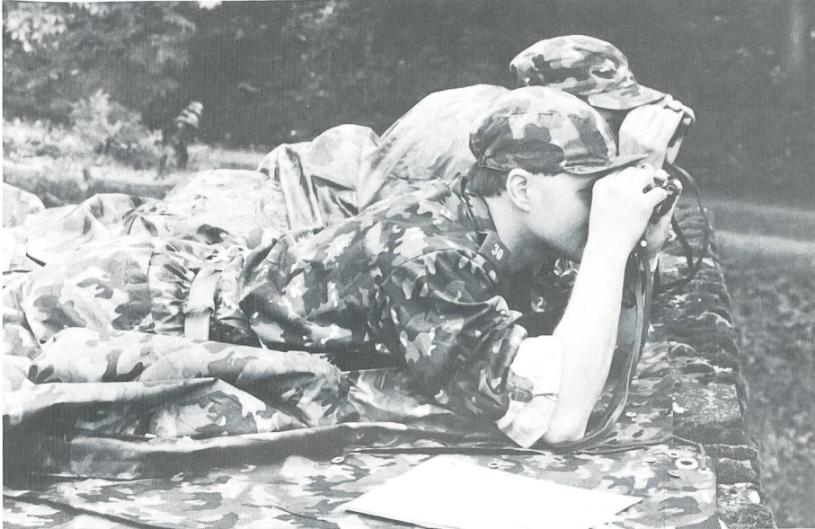
Die Feldweibel und Adjutant Unteroffiziere massen sich am Ostschweizer Feldweibeltag in militärischen Disziplinen, wie hier beim Posten Beobachten/Melden.

Die Thurgauer haben sich am Ostschweizer Feldweibeltag vom 25. September in Herisau klar durchgesetzt. Im friedlichen Wettkampf unter 100 Feldweibeln und Adjutant Unteroffiziere belegten sie in der Einzelrangliste gleich den ersten und den dritten Platz. Erstmals wurden am Feldweibeltag moderne Wettkampfformen eingeführt. Eine interessante Ausrüstungs- und Waffenschau rundete den leicht regnerischen Tag ab.