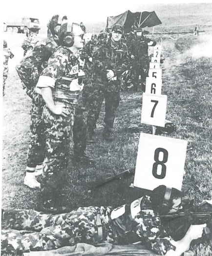
Konzentration für Schiessende und Beobachter.