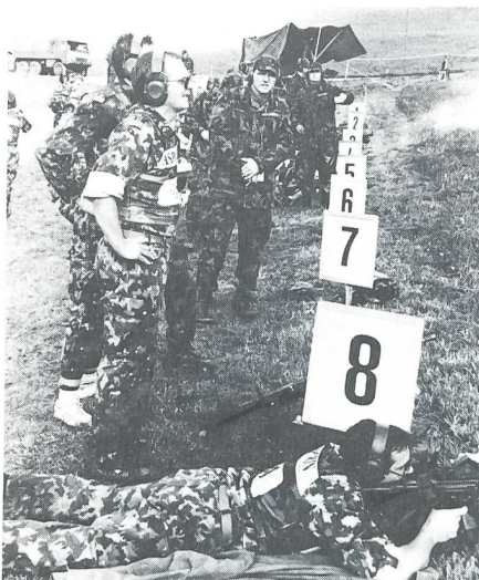
Konzentration für Schiessende und Beobachter.