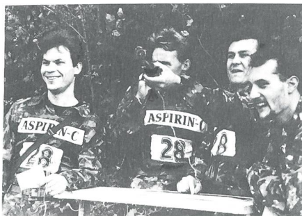
Einmal mehr stellten die technischen Disziplinen «Distanzschätzen» und das Bestimmen von Geländepunkten hohe Ansprüche.