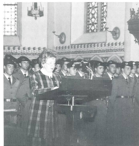
Nationalrätin Vreny Spörri bei ihrer Ansprache.