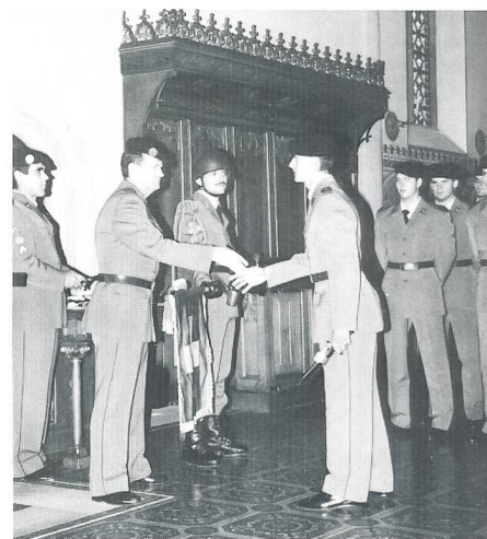
Schulkommandant Oberst Thurnheer bei der Brevetierung.

eingetragen. Nach der Begrüssungszeremonie sprach Divisionär Troller , Waffenchef der FF-Truppen. Er meinte, nur glaubhafte junge Menschen könnten eine so harte militärische Ausbildung, wie sie die anwesenden Aspiranten erlebt haben, bestehen. Und dies sei gleichzeitig auch eine Erwachsenenausbildung, die auch im Zivilleben nur Vorteile bringen könne. Namentlich wurden die Offizierschüler zur Brevetierung aufgerufen.