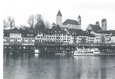
Rapperswil, Ort der Brevetierung. Schloss und Stadtkirche.

Punkt 13.30 Uhr meldete Oberst René Thurnheer dem anwesenden Korpskommandanten «Carrel» . Zu den Klängen des Fahnenmarschs wurde die Standarte der Flieger- und Fliegerabwehr-Schulen her-