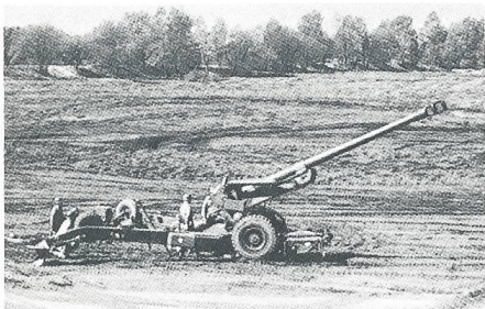
Feldhaubitze FH 70

Dass unsere beiden noch im Dienst stehenden gezogenen Geschütze 10,5-cm-Kanone 35 und die 10,5-cm-Haubitze 46 nicht mehr das Neueste auf dem Markt sind, ist bekannt. Nichtsdestotrotz sind sie aber mit einer motivierten, gut ausgebildeten Geschützbedienung noch sehr leistungsfähig und wirkungsvoll. In der Armee 95 wird unsere 10,5-cm-Kan, bald 60 Jahre alt, keinen Platz mehr finden. Die leistungsgesteigerte 10,5-cm-Hb wird weiterhin im Geb AK 3 verwendet. Das britische Leichtgeschütz 105 mm Light Gun, das geringfügig abgeändert in den USA als M119 eingeführt wurde, erfüllt die Bedingung der Lufttransportfähigkeit optimal. Ausserdem