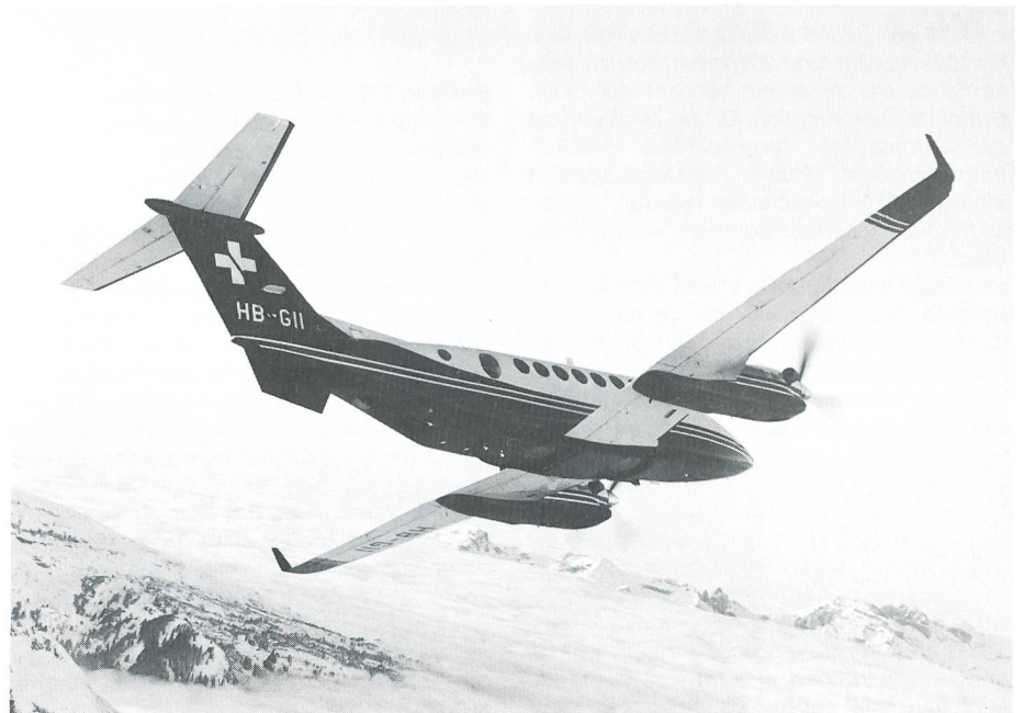
Neues Vermessungsflugzeug Super King Air 3500 HB-G11 vor den Churfürsten. Auf der Unterseite des Rumpfs sind die Kamerasysteme eingebaut.

Besitzerin des Flugzeuges ist das BA L+T, welches zum Eidg Militärdepartement gehört. Die hochqualifizierte Besatzung des Super King Air rekrutiert sich aus dem Überwa-