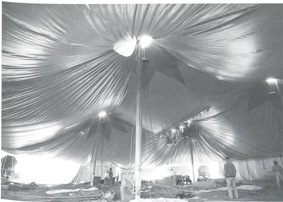
Das 3000 Personen fassende Zelt stellen 28 Mitarbeiter des Circus Knie in vier bis maximal sechs Stunden bezugsbereit auf.

Schweiz rund 235 Abend- und 140 Nachmittagsvorstellungen. Damit da alles rund läuft, braucht es eine Top-Organisation. Knie hat sie. Die Genie-OS 2/93 durfte «hineinschauen».