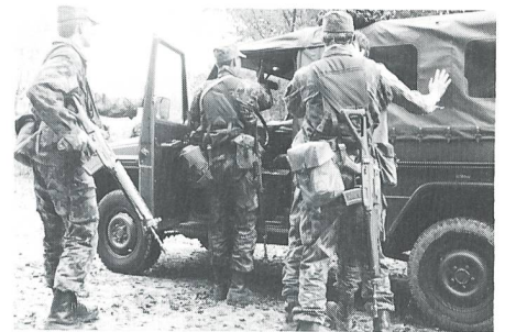
Bei der Wettkampfdisziplin «Technik Bewachung» gibt es verschiedene Problemstellungen, z.B. das Durchsuchen eines Fahrzeuges ...

Bei der «Technik Bewachung» steht die Verhältnismässigkeit im Zentrum. Bei den drei zu bearbeitenden Problemstellungen ist Denken im Rahmen des Teams ebenso gefragt wie das Beherrschen der wichtigsten Techniken. Wie überall im Wettkampf wissen die Teilnehmer bereits jetzt in der Trainingsphase, mit welchen Problemstellungen sie konfrontiert werden könnten. Welche konkrete Situation am Wettkampf aber tatsächlich auf sie zukommt und wer