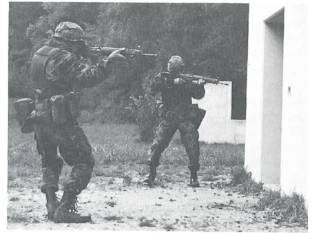
... ist auf das neue Sturmgewehr zugeschnitten.

kampf verlangen, wird auf unserem Video dokumentiert. Wer bereits über eine ausgefeiltere Technik verfügt, darf ungeniert etwas reduzieren. Wir sind der Meinung, dass das, was wir fordern, eine sehr gute Grundlage für jede Art der technischen Verfeinerung darstellt: Fundamente sind dazu da, um Häuser darauf zu bauen.