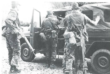
Bei der Wettkampfdisziplin «Technik Bewachung» gibt es verschiedene Problemstellungen, z.B. das Durchsuchen eines Fahrzeuges ...

Bei der «Technik Bewachung» steht die Verhältnismässigkeit im Zentrum. Bei den drei zu bearbeitenden Problemstellungen ist Denken im Rahmen des Teams ebenso gefragt wie das Beherrschen der wichtigsten Techniken. Wie überall im Wettkampf wissen die Teilnehmer bereits jetzt in der Trainingsphase, mit welchen Problemstellungen sie konfrontiert werden könnten. Welche konkrete Situation am Wettkampf aber tatsächlich auf sie zukommt und wer