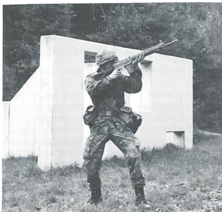
Die Wettkampfdisziplin «Technik Häuserkampf» ...

Bei der «Technik Häuserkampf» geht es darum, ein kleines Gebäude ohne Gebrauch von Handgranaten zu säubern. Im Dreier-Team werden drei kurze Sequenzen so aneinandergehängt, dass eine Gruppenaktion entsteht. Die Übung ist auf das neue Sturmgewehr zugeschnitten und zeigt, welche Möglichkeiten uns diese Waffe bietet. Wir wissen, dass gerade hier die geforderte Technik vielen unbekannt und allzu modern erscheint, manchen andererseits noch zu wenig ins Detail geht. Es ist daher nicht verwunderlich, dass wir deswegen von vielen Seiten kritisiert und mit Vorurteilen überhäuft wurden. Tatsache ist, dass man sich bei der Planung eines Wettkampfs immer wieder überlegen muss, was für die Schiedsrichter noch bewertbar und was für die Wettkämpfer noch machbar ist. Wir haben uns beispielsweise deswegen dazu durchgerungen, beim Häuserkampf Absprachen und Kurzbefehle konsequent mündlich zu verlangen, wissen aber sehr wohl, dass eingespielte Teams eine lautlose Verständigung mit Zeichen vorziehen. Wie wir die Übungen am Wett-