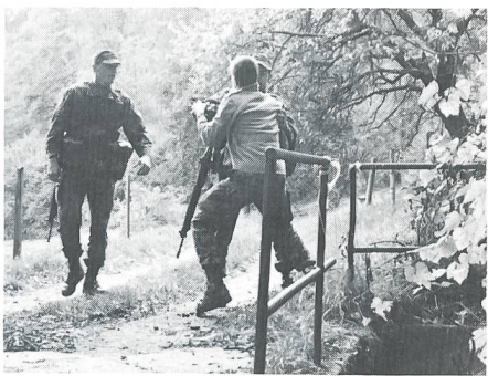
... oder das Fassen eines Verdächtigen.

als Teamchef auftreten muss, entscheidet erst das Los an Ort und Stelle. Ein Beispiel: Bei der Zutrittskontrolle kann es sein, dass die zu kontrollierende Person sich entweder als harmlos herausstellt oder dass sie plötzlich handgreiflich wird oder aber gar ein Messer zieht: Gute Gesprächstechnik, systematische Grobdurchsuchung, gegenseitige Unterstützung im Team, lagegerechtes Beherrschen von Techniken – die Liste zur Bewältigung der Problemstellungen könnte noch fortgesetzt werden.