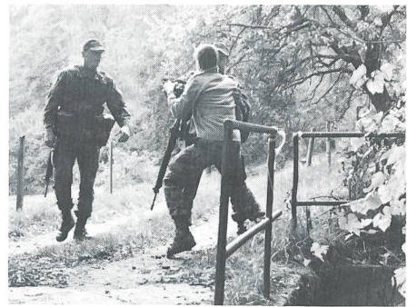
... oder das Fassen eines Verdächtigen.

als Teamchef auftreten muss, entscheidet erst das Los an Ort und Stelle. Ein Beispiel: Bei der Zutrittskontrolle kann es sein, dass die zu kontrollierende Person sich entweder als harmlos herausstellt oder dass sie plötzlich handgreiflich wird oder aber gar ein Messer zieht: Gute Gesprächstechnik, systematische Grobdurchsuchung, gegenseitige Unterstützung im Team, lagegerechtes Beherrschen von Techniken – die Liste zur Bewältigung der Problemstellungen könnte noch fortgesetzt werden.