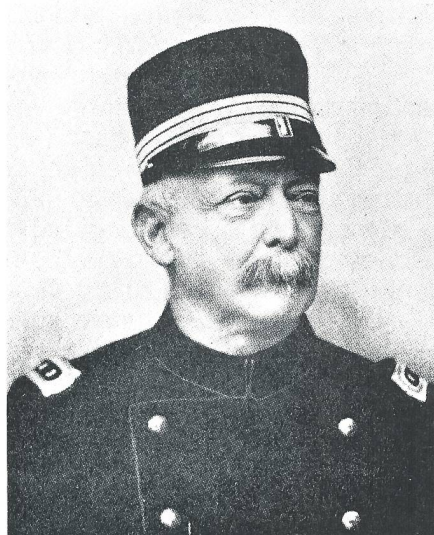
General Hans Herzog, Oberbefehlshaber der Schweizer Armee 1870/71. Herzog war Ehrenmitglied des Eidgenössischen Unteroffiziersverbandes. Aus CH-Soldat Nr 20/64

In drei Exemplaren ausgefertigt in Les Verrières, am 1. Februar 1871. (Unterschrift) Clinchant (Unterschrift) Hans Herzog General