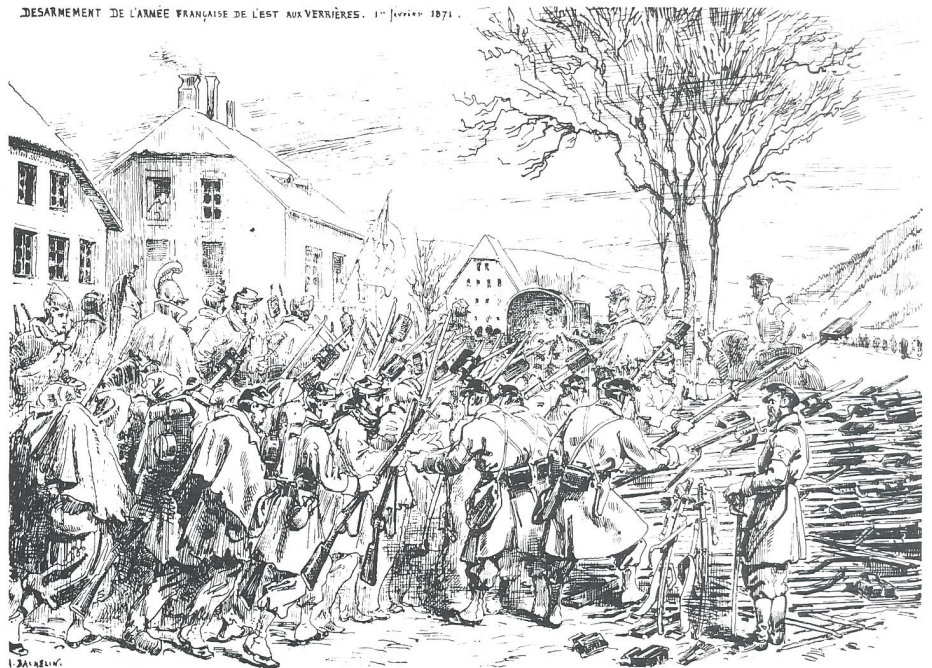
Entwaffnung der in die Schweiz übergetretenen Angehörigen der Bourbaki-Armee. A Bachelin aus Buch «100 Jahre CH-Armee» vom Ott-Verlag Thun

Im Frühsommer 1870 kandidiert Erbprinz Leopold von Hohenzollern-Sigmaringen als König von Spanien. Die französische Regierung sucht diese Thronbesteigung mit allen Mitteln zu verhindern. Der Vater des Erbprinzen will die Franzosen nicht unnötig erzürnen und veröffentlicht daher am 12. Juli im Namen seines Sohnes eine offizielle Verzichtserklärung. Damit wären eigentlich die Differenzen bereinigt. Der übereifrige französische Botschafter, Graf Benedetti, glaubt aber am darauffolgen-