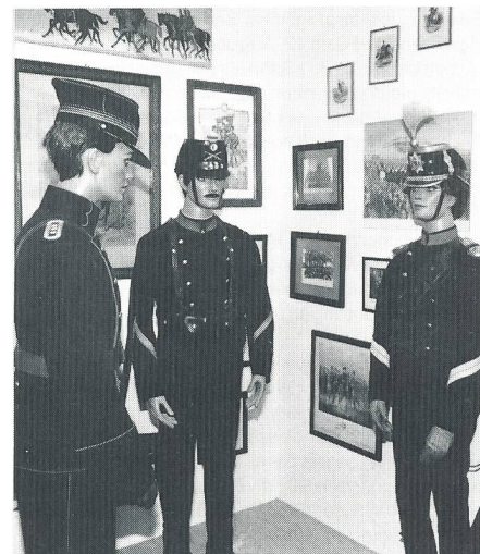
Landwehr-Offiziere aus dem 1. Weltkrieg: ein Genie Hptm, ein Füsilier Kpl und ein Guide (Meldereiter) mit Federbusch auf dem Helm.