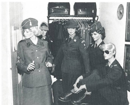
Frauen in der Schweizer Armee: Rotkreuzdienst – FHD – MFD.