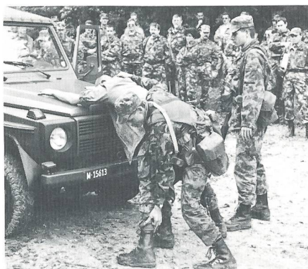
Demonstration Fahrzeugkontrolle (Technik Bewachung).

wie Trainingsveranstaltungen in den Sektionen durchgeführt werden könnten, und macht den zu vermittelnden Stoff auch für Nicht-Infanteristen zugänglich.