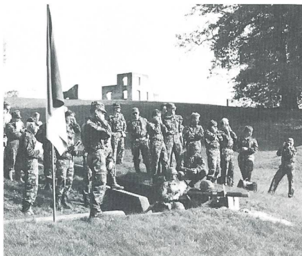
Demonstration Panzerabwehr-Team (Gefechts-schiessen im Team).

An insgesamt 4 Veranstaltungen werden die Wettkämpfe im Massstab 1:1 den Übungsleitern und TK-Chefs der einzelnen Sektionen vorgestellt. Wir haben uns entschieden, nach Schwierigkeitsgraden und Trainingsaufwand vorzugehen: Am 16. Oktober des