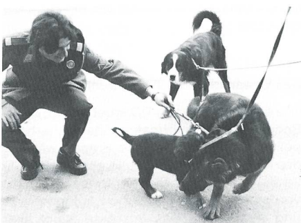
Tierischer Ernst in der Kaserne Moudon.