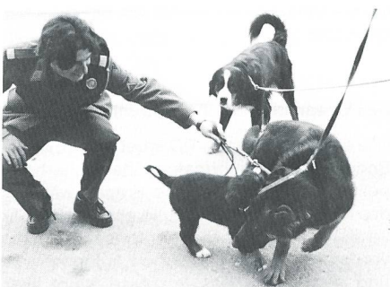
Tierischer Ernst in der Kaserne Moudon.