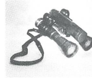
MODEL FLIN Topgerät binokular mit sensationalen Leistungen (2,5x42) Für Langzeitbeob. gut geeignet Preis nur Fr. 880.-