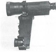
Modell ZYKLOP mit sehr guter Optik (1,5x85) im Griff eingebautem IR-Scheinw. 1,5- und 9-V-Batterien. Tiefstpreis-Angebot nur Fr. 590.-