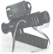
Modell S+ einfacher Restlichtverstärker mit aufgebautem IR-Scheinwerfer, 1,5 V, mit praktischer Tasche Fr. 495.- (Mod. S ohne IR nur 440.-)

Aus ehemaligem WAPA-Staat für Sie importiert!