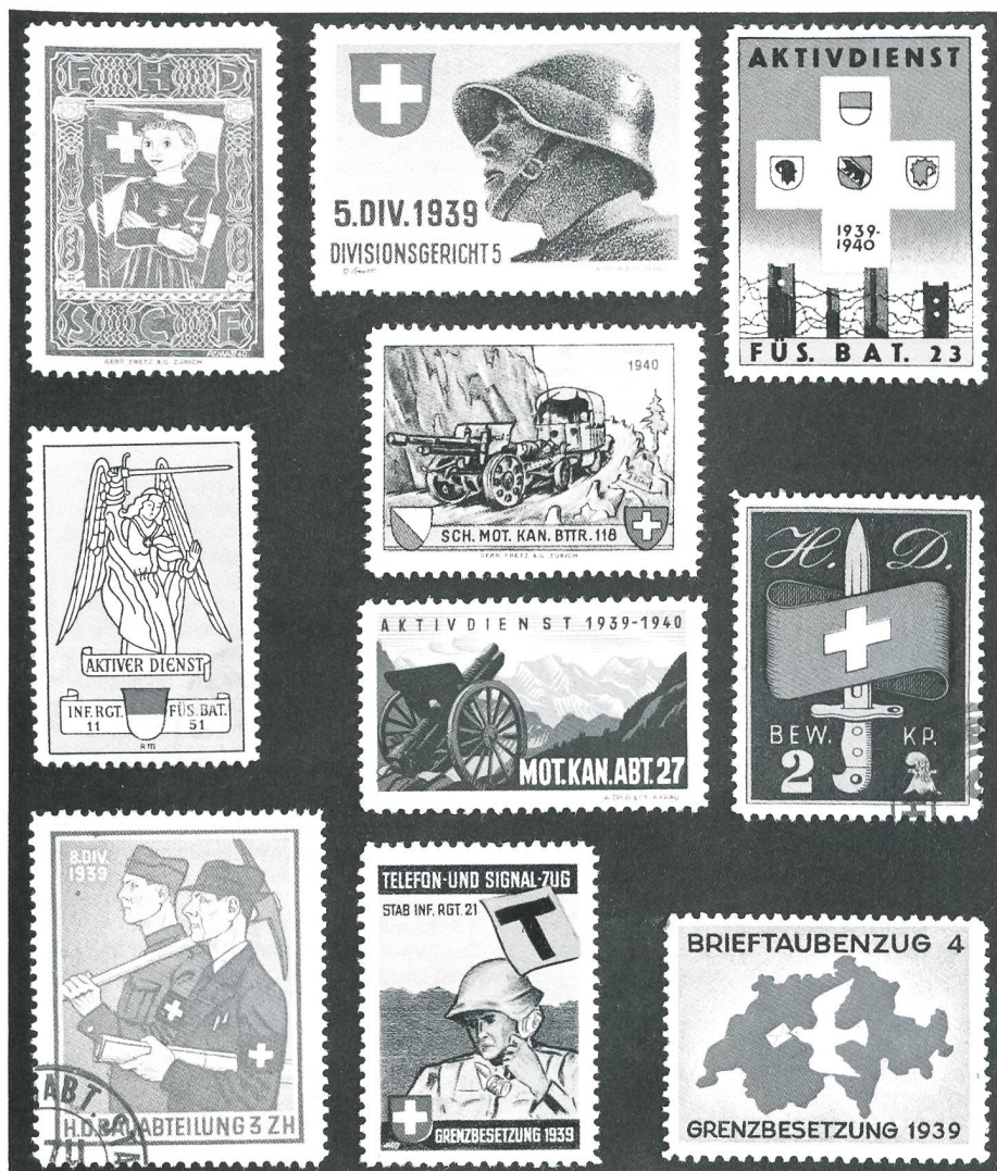
1939 bis 1945