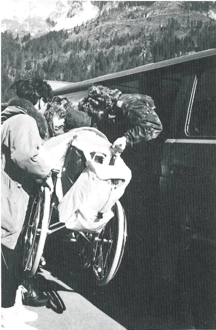
Mit vereinten Kräften gelang der Verlad.