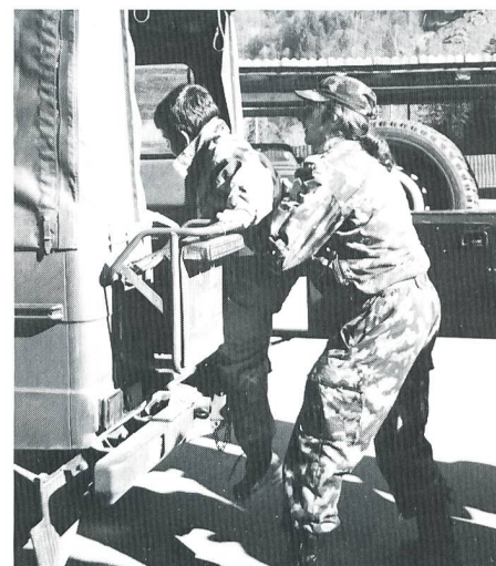
Mit viel Einsatz und Begeisterung bei der Arbeit während der Übung «Schneemann».