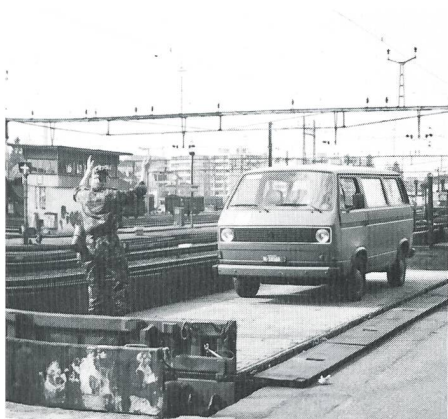
Die Fahrzeuge werden auf die Bahn verladen.

Kinder, die ihren Rollstuhl nicht verlassen konnten, ging die Reise mit Schneemobilen weiter, ins kinderfreundliche Hotel Glogghuis. Der Küchenchef servierte ein reichliches Mittagessen. Die Betreuer und die Armeeingehörigen hatten alle Hände voll zu tun, arbeiteten reibungslos zusammen, und die Freude der Kinder war unbeschreiblich. Um 15 Uhr erwies sich die Lage in Hagendorn als doch nicht so gravierend, und die Heimbewohner