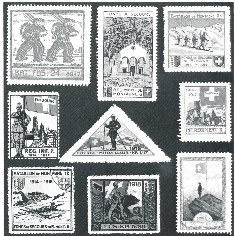
1914 bis 1918