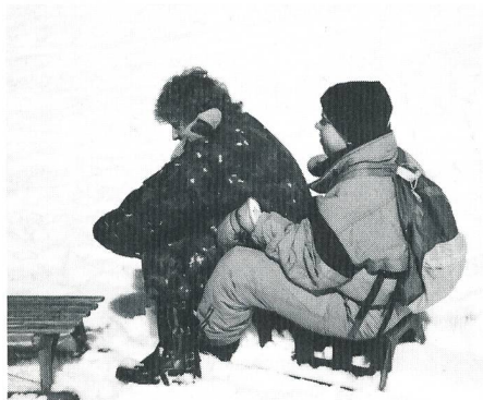
Das Schlittenfahren wurde genossen.