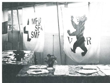
Blick auf den MFD-Stand: Blumen sind immer dabei!

Es würde mich sehr freuen, die eine oder die andere wieder im Herbst begrüßen zu können.