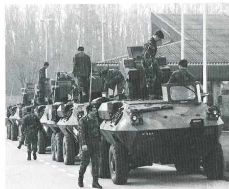
Die Demonstration der Piranhas vermochte alle zu interessieren.

hätten wie diesmal aus der San Trsp Kp MFD III/3 (+).