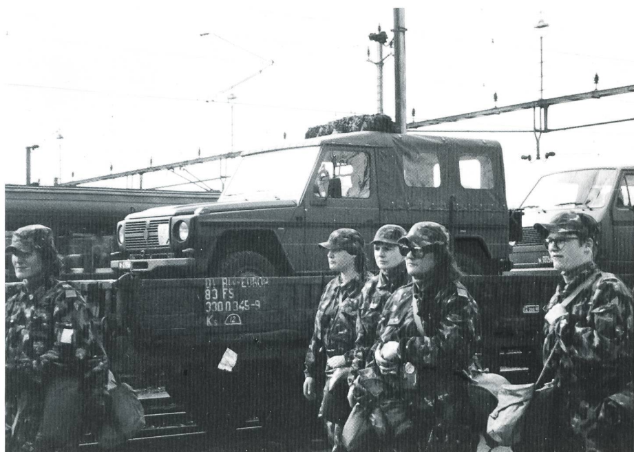
«Abschied» von den Fahrzeugen.

Zwei vorzeitig entlassene Männer sagten, dass sie noch nie so ungerne den WK verlassen