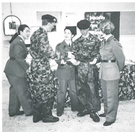
Im Gespräch mit Kameraden, die nun bestens im Bild sind, was Frauen in der Armee machen.