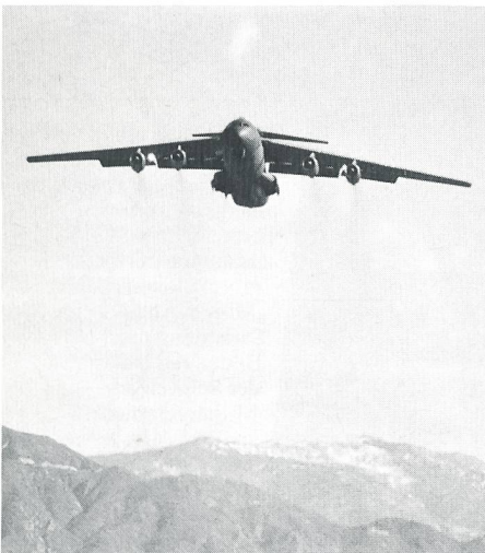
Steil nach oben, um rasch aus dem Wirkungsbereich der Flugabwehrsysteme zu gelangen.

Die Operation «Provide Promise» begann am 3. Juli 1992. Sie wurde notwendig, weil bosnisch-serbische Einheiten alle Strassenverbindungen nach Sarajewo sperrten. UN-Transporte von Hilfsgütern zugunsten der notleidenden Zivilbevölkerung konnten auf dem Landweg nicht mehr im notwendigen Ausmass durchgeführt werden. Die Vereinten Nationen entschlossen sich daher, eine Luftbrücke (AIRLAND) einzurichten, um die belagerte bosnische Hauptstadt mit Grundnahrungsmitteln versorgen zu können. Über diese Luftbrücke erhält Sarajewo rund 76 Prozent seiner Grundbedürfnisse an Nahrung und Medikamenten. Das UNO-Hochkommis-