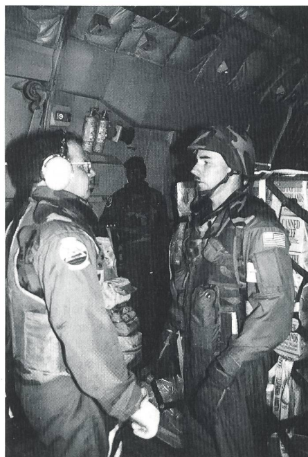
Ein neues Gefühl für Besatzungen von Transportflugzeugen: Tragen von Splitterschutz- und Survivalwesten.

Kaum hat die C-141 die Piste berührt, wird voll abgebremst. Während wir zu unserer Abstellposition rollen, wird der Laderaum geöffnet. Es gilt keine Zeit zu verlieren. Die Maschinen bleiben maximal nur 15 Minuten in Sarajewo am Boden. Solange haben unsere Loadmasters Zeit, die Maschine zu entladen. Französische Soldaten der UNPROFOR kommen an Bord, um beim Entladen zu helfen. Die rund eine Tonne schweren Paletten müssen von Hand auf dem Rollboden aus dem Flugzeug gestossen werden. Draussen werden sie von