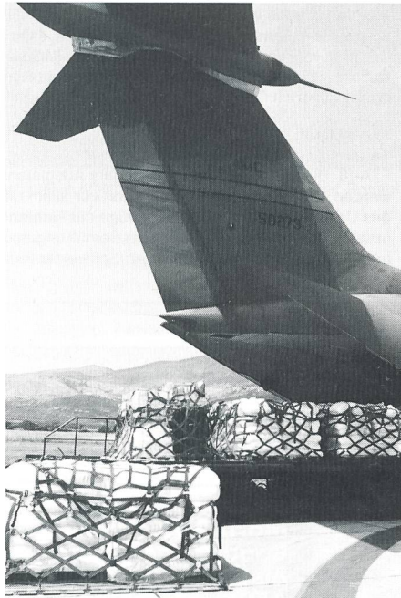
In Split werden 12 Tonnen Mehl geladen.

sariat für Flüchtlinge (UNHCR) errechnete zum Beispiel für den Monat Februar 94, dass insgesamt 7523 Tonnen Nahrungsmittel benötigt würden, um jedem Bewohner der Stadt eine warme Mahlzeit pro Tag abgeben zu können.