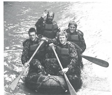
Froh gelaunt auf der alten Aare.