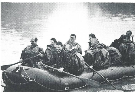
An der Reusstalfahrt: das Gästeboot bei strömendem Regen.

Ein sehr grosses Kompliment muss hier dem Materialtrupp gemacht werden, der trotz unterdotiertem Bestand die Abgabe des sehr stark verschmutzten Materials bewältigte.