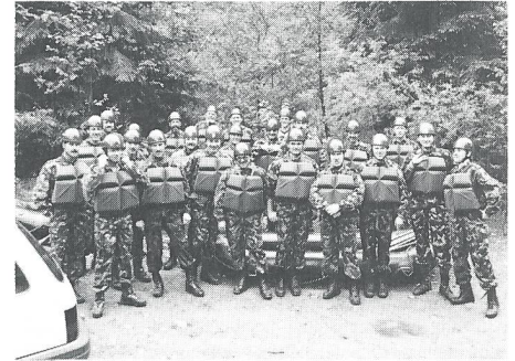
Die Teilnehmer der Kaderübung «Canyon», gut ausgerüstet mit Schwimmweste und Bergsteigerhelm.