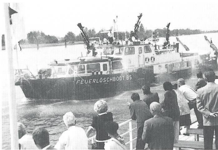
Am späteren Nachmittag demonstrierte das Basler Feuerlöschboot «Christophorus» sein Können auf dem Rhein.

ren beispielsweise Massnahmen gegen Missbräuche im Ausländerrecht ebenso wie Vorschriften gegen den Drogenhandel, das organisierte Verbrechen und den Waffenmissbrauch.