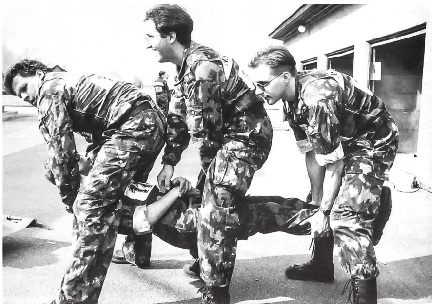
Heben und Umlagern im Brückengriff.