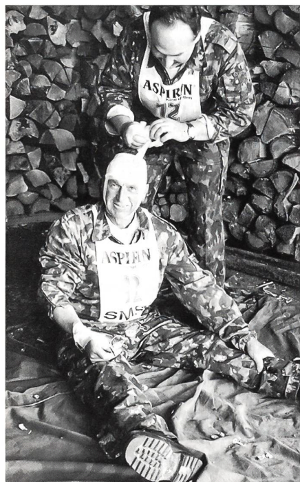
Erste Hilfe: «Kopfverband».

In seinem Grusswort an den SMSV schrieb Bundespräsident Villiger: Wenn wir den Fernseher aufschalten, werden wir immer öfters Zeuge kriegerischer Auseinandersetzungen, in deren Verlauf alles das, was einst wie bei uns funktioniert haben mag, zerstört wird.