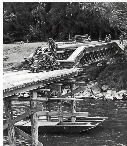
Rückzugsarbeiten an der «Kombi-Brücke» bei Amlikon. Pontons dienen als Arbeitsbühne.

chem die Kommandanten an ihre ungewohnte Aufgabe gingen. Eindrücklich waren auch Motivation und Einsatz der Truppe. Ich denke zB an die Grenadiere auf und um den Übungszug in Etwilen; ich denke an die Füsilieri, die mir den Zutritt zu Bahnstationen verwehrt. Ich bin froh, dass ich der Übung «Scirocco» folgen durfte; sie hat mir altgedientem Soldaten neue Einsichten eröffnet.