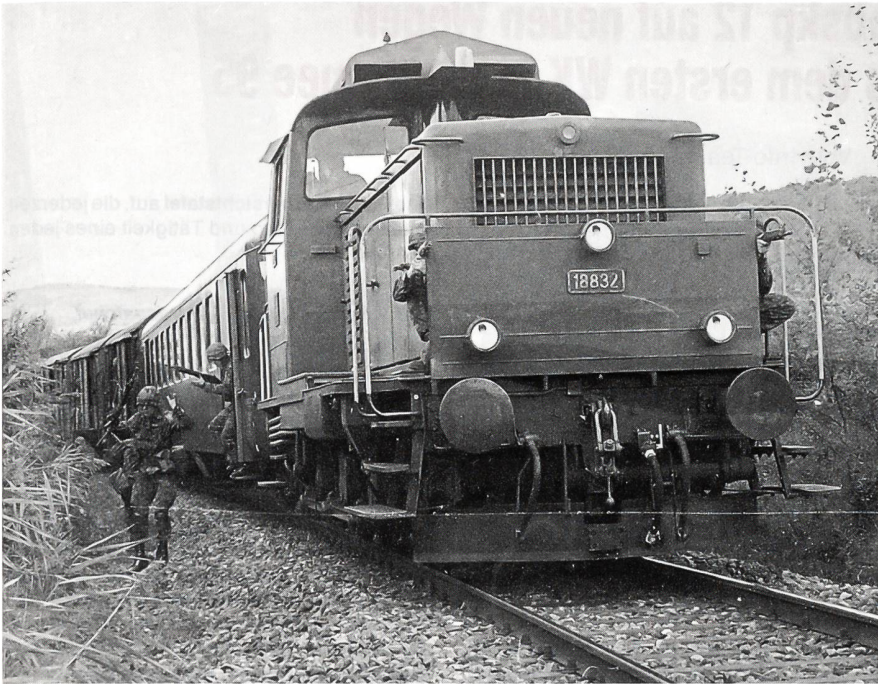
Blitzartig reagieren die Grenadiere beim Anhalten des «Übungszuges» in Etwilen.

Bahnbetrieb wichtig? Sind es die Stellwerke? Sind es die Trafostationen (ohne Strom fährt kein Zug)? Sind es Strassenüberführungen? Ist es zum Teil auch das Zwischengelände? Aus diesen Absprachen ergab sich die Zahl von 18 Aufträgen.