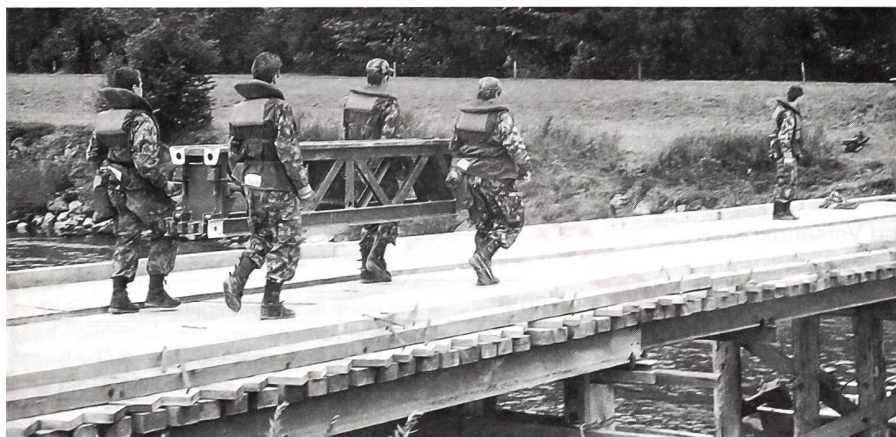
Bei Amlikon: Brückenbau ist harte Arbeit.

Auf dem Bahnhof Etzwilen orientierte der Kdt Füs Bat 68 über seinen Auftrag: Bewachen/Überwachen und Sichern von stationären Objekten von Etzwilen bis Ossingen exklusive, insgesamt deren 18. Eine Kp habe er in Etzwilen eingesetzt, eine im Zwischengelände bis Stammheim, eine in Stammheim selbst und eine im Zwischengelände bis Ossingen. In der Rekognoszierungsphase sei der Verbindungsaufnahme mit den Stationsvorständen grosse Bedeutung zugekommen zur Abklärung folgender Fragen: Was ist für den