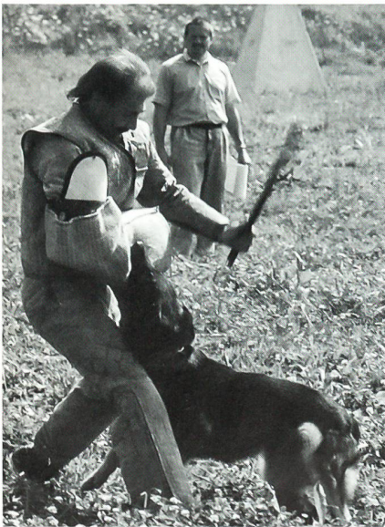
Der Schutzhund weicht der Gefahr nicht aus, sondern springt den «Verdächtigen» an.

an dem zur Eröffnung des HAZ durchgeführten Wettkampf teilzunehmen. Ausgetragen wurden die Disziplinen « Unterordnung » und « Schutzdienst ». Hinzu käme nach internationaler Wettkampfprüfungsordnung noch die Fährtenarbeit, welche aber an diesem Anlass nicht geprüft wurde. Die Gästeschar staunte nicht schlecht, als die Hundeführer mit ihren Hunden vor die Aufgabe gestellt wurden, einen versteckten Täter aufzustöbern und nach dessen Auffinden zu verbellen. Konsequenterweise suchte der Hund entsprechend den Anweisungen seines Führers einen versteckten « Täter » und stellte sich dermassen bellend vor dem Figuranten auf, dass dieser nicht den Hauch einer Chance hatte, um zu entfliehen. Gleich ging es denjenigen « Verdächtigen », die auf ein klares und bestimmtes « Halt, Militär! » nicht reagierten. Unverzüglich schickten die Hundeführer ihre Hunde los, um die Entwichenen aufzuhalten und anzufallen. Zum Glück tragen diese dick gepolsterte Kleidung. Ebenso schnell lassen die Hunde aber vom « Täter » ab, wenn es der Führer von ihnen fordert. Erstaunlich dabei war aber, dass die Hunde von den « Verdächtigen » auch dann nicht lassen, wenn diese den Hunden mit einem Stock recht ordentliche Schläge aus teilen.