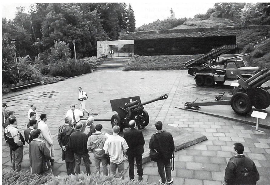
Besuch in der Gedenkstätte Seelower Höhe. Im Vordergrund russische Artilleriegeschütze und im Hintergrund das Ehrenmal der russischen Gefallenen.