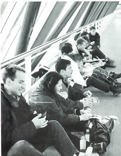
Zvieri-Rast auf einem Autobahnsteig.

Bei der Reise nach Frankreich waren es 30 Herren und Damen. Nach Berlin brachten wir nur eine Gruppe von 18 Teilnehmern zusammen. (Siehe nachfolgenden Bericht von Fabian Coulot). Der tiefere Inhalt unserer Absicht, solche Reisen zu organisieren, bringt uns dazu, auch für die nächsten Jahre zu planen. So soll das Reiseziel im Oktober 1996 die Brücke von Remagen (Rheinübergang der Alliierten im März 1945) sein. In Budapest wollen wir im Frühjahr 1997 versuchen, die auch von Studenten getragene ungarische Revolution (1956) gegen den Kommunismus nachvollziehen zu können. Die Reisen werden frühzeitig in der Zeitschrift «Schweizer Soldat» ausgeschrieben. Wir hoffen, dass eine genügende Zahl von Jungen sich dafür interessieren wird.