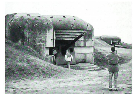
Artilleriebunker des deutschen Atlantikwalls.

Nach der rund neunstündigen Zugfahrt von Zürich via Basel und Mannheim nach Berlin-