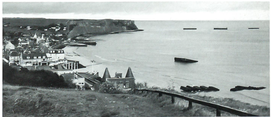
Die Bucht bei Arromanches mit einigen «versenkten» Pontons als Restteile des Invasionshafens.

Die reservierten Zweitklassplätze und das gemeinsame Mittagmahl im Speisewagen schaffte die Voraussetzungen, dass schon bei der Ankunft in Paris kurz nach Mittag, vom Donnerstag, 21. Oktober, sich alle schon beim Vornamen nannten und die unterhaltende Reise fast zu kurz erschien. Mit einem Car transportiert, erreichten wir in einer etwa drei Stunden dauernden Fahrt unser erstes Tagesziel, das Hotel in Bayeux. Vor dem Nachtessen galt es noch, mit einem kurzen Einblick auf die Invasionsküste das Interesse für den folgenden Tag zu wecken. Der Samstag war dann reich befrachtet mit der Besichtigung des Museums und der noch sichtbaren Reste des mehr als 2 km breiten von England hergeschleppten künstlichen Hafens von Arromanches, der verschiedenen deutschen Befestigungs- und Artilleriewerke des sogenannten Atlantikwalls, der nachgebildeten Luftlandeoperationen von Ste-Mère-Eglise und die Fels- oder Sandküsten der sehr verlustreichen amphibischen Landungsoperationen der Amerikaner. Kaum vorstellbar, dass am D-Tag