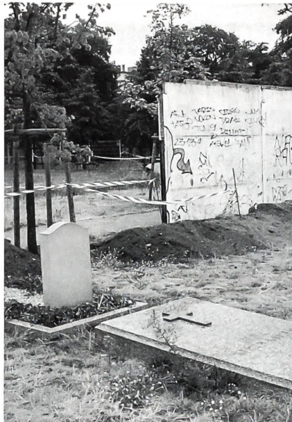
Das Grab vom Fliegergeneral Ernst Udet auf dem Invalidenfriedhof in Berlin. In der Bildmitte ist noch ein Stück «Berliner Mauer» zu sehen.

Der militärhistorische Spaziergang führte uns von der Moltkebrücke an der Schweizer Gesandtschaft und am Konsulat vorbei zum Reichstagsgebäude, auf demselben Weg befanden sich vor 50 Jahren die Rotarmisten im Angriff, als sie das Reichstagsgebäude stürmten. Das Schweizer Konsulat war das einzige Gebäude, welches im Botschaftsvier-