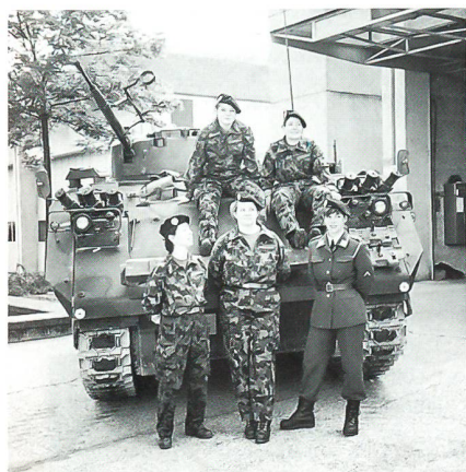
Ein kleiner Teil der einsatzfreudigen Frauen des Thu- ner Verbandes

Zudem wurden die folgenden Verkaufsartikel mit Werbeaufdruck vertrieben: ein Mini-Taschenradio mit Kopfhörer und automatischem Sendersuchlauf, Ta- schenlampe im Kugelschreiberformat und als Ess- besteck verwendbares, aufklappbares Sackmesser. Die praktischen und vielseitig verwendbaren Utensilien stossen zwar auf grosse Akzeptanz, kamen jedoch nicht an die Wirkung des neuen TAZ 95 heran. Dieser wurde anstelle der blauen Uniform getragen, die meist mit der Heilsarmee oder dem Frauenhilfs-