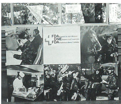
Das neue Erscheinungsbild – FDA – Frauen in der Armee

dienst in Verbindung gebracht wurde. Diese falsche Vorstellung erweckte der neue TAZ bei den Besu- chern nicht mehr.