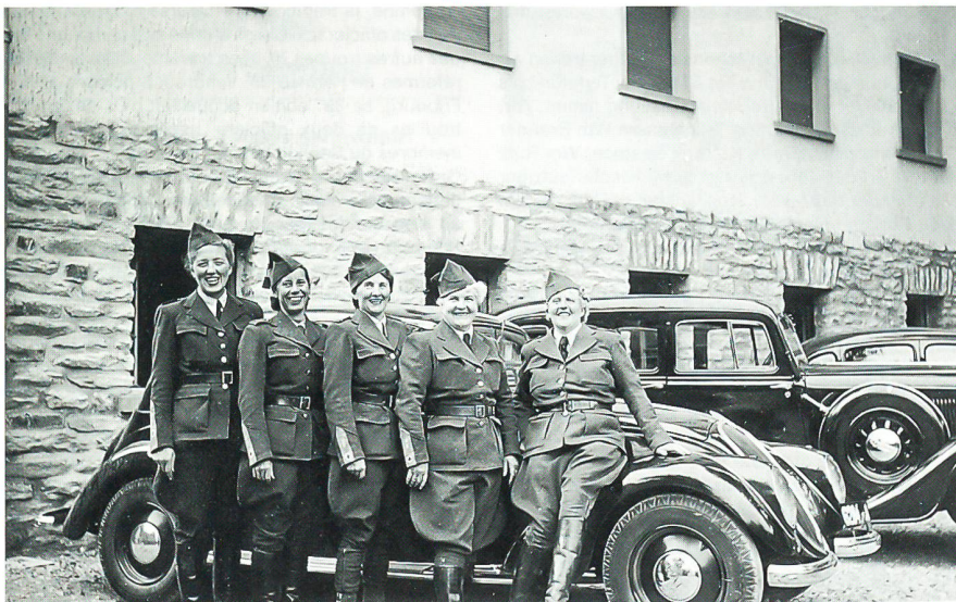
Besuch von unserem «Wachtmeischerli»

während den Manövern wird kein Ausgang sein. Hedy kann bei uns bis morgen abend bleiben. In Corpore sind wir im «Cervin» bei Frau Poltera zum obligaten «Spargle bis gnue» Essen. Schade, dass ich noch zum Rapport nach Brig muss. Wieder zurück, treffe ich die ganze Corona beim Schmaus von Walliser trockenfleisch und Fendant, bei bester Stimmung!