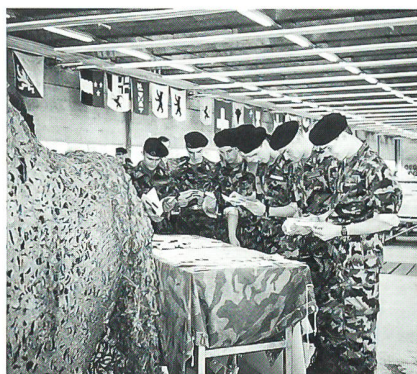
Die Soldaten auf dem Waffenplatz Thun zeigten sich sehr interessiert am Stand der FDA – Frauen in der Armee