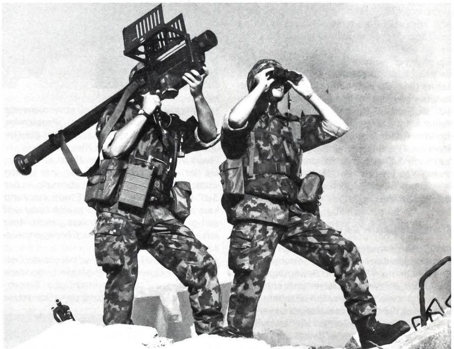
Bekannt aus dem Afghanistankonflikt: Die leichte Flakenlenkwaffe «Stinger»

stationär, zum Beispiel auf Flughäfen genutzt. Auf Schiffe montiert wurde er auch im Falklandkrieg eingesetzt. Mit der Umsetzung der Armee 95 werden die