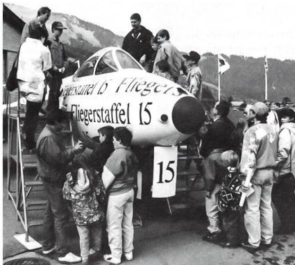
Das Interesse am «Papyrus-Hunter» war am 8. Oktober 1994 sehr gross.

Die legendären Hunter-Flugzeuge der Schweizer Flugwaffe wurden bekanntlich nach 36 Dienstjahren Ende 1994 ausgemustert. Die meisten Hunter werden verschrottet, nur wenige werden in Museen landen und erhalten bleiben. Anlässlich des letzten Hunter-WKs der Fliegerstaffel 15 im November 1993 auf dem Flugplatz St. Stephan wurde von den Staffellangehörigen, insbesondere durch Staffellokommandant Ueli Leutert, die Initiative ergriffen, für diesen Abschied einen speziellen Hunter, im Staffel-Look zu bemalen (siehe Bericht «Schweizer Soldat», Mai 1994). Bald kam die Idee auf, diesen einmaligen und schönen Hunter nicht zu verschrotten, sondern zu erhalten und in St. Stephan zu belassen.