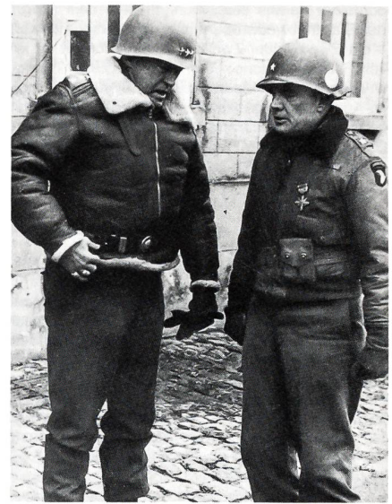
General Georges Patton mit dem Kdt der amerikanischen 101. Luftlandedivision, General Anthony McAuliffe.

Amerikaner, Belgier und hohe alliierte Militärs haben am 16. 12. 1994 mit einer Zeremonie in der belgischen