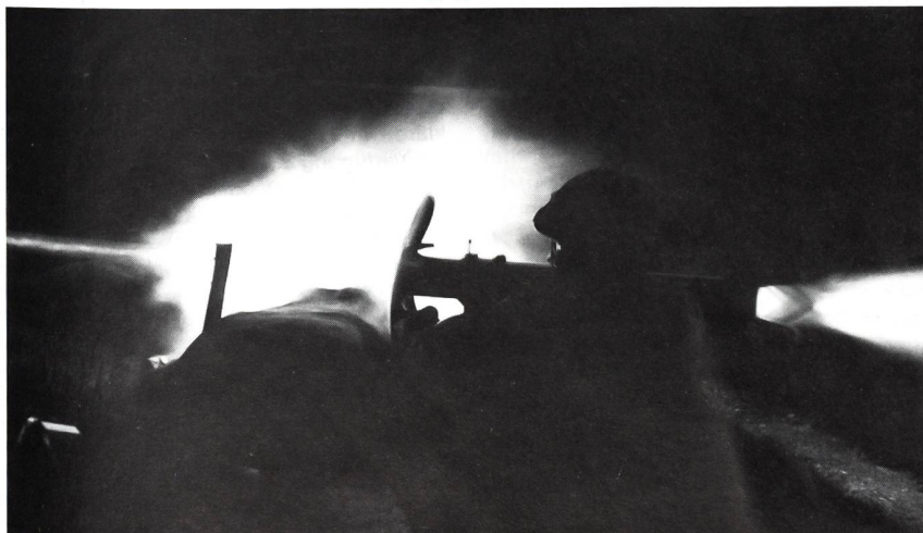
Auf dem Bild sieht man Asp Sacha Weibel beim Schiessen eines URak's mit dem Rak Rohr (die PzF hatte noch nicht Einzug gehalten) anlässlich der Schiessverlegung der Vsg OS 2/94 auf dem Spittelberg. Im richtigen Moment abgedrückt hat auch der Fotograf