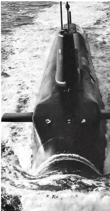
Das neueste britische Raketen-U-Boot: die atomgetriebene, 16 000 t (getaucht) verdrängende «HMS Vanguard». Sie ist das Leitschiff der insgesamt vier Boote umfassenden seegestützten Atomstreitmacht Englands. Das Boot führt 16 Interkontinentalraketen des amerikanischen Typs Lockheed «Trident» D-5 mit. Diese Raketen befinden sich in vertikalen Startsilos hinter dem Turm. Die Ruder vorne dienen der Höhen- resp Tiefensteuerung unter Wasser.

Es ist in der Tat so, dass die Bedeutung der nuklearen Abschreckung abgenommen hat. Aber kein Nuklearwaffenstaat geht heute so weit, dass er diese Waffen gänzlich abschafft. Auch die auf Unabhängigkeit bedachten Engländer und Franzosen beabsichtigen nicht, den verbleibenden Restrisiken mit einer gänzlichen Aufgabe der Nuklearwaffen zu begegnen. Dies erst recht nicht, weil beide auch ihre taktischen Nuklearwaffen merklich reduziert, teils sogar eliminiert haben. Mit vier (bei den Franzosen fünf) Einheiten soll gewährleistet werden, dass sich im Krisenfall mindestens ein (im Falle Frankreichs zwei) Boot(e) rund um die Uhr im Einsatz befindet. Mit der veränderten sicherheitspolitischen Weltkarte haben die Nuklearstaaten, das wurde zumindest von amerikanischer Seite öffentlich bekannt, ihre nukleare Zielplanung verändert bzw. angepasst. Die Beendigung des «Kalten Krieges» vorab in Europa bedeutet nicht, dass alle Konflikte verschwinden. Die Realität belegt, dass laufend neue Krisen-