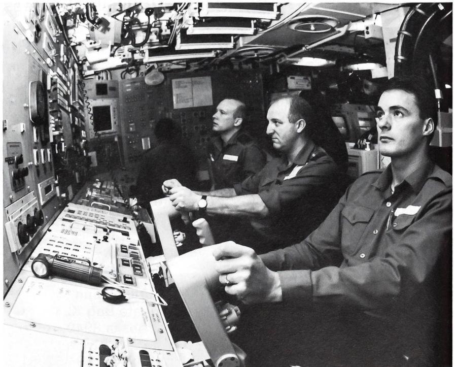
Der Kontrollraum des U-Bootes «HMS Vanguard». Diese drei Seeleute steuern, unter Aufsicht des diensthabenden Offiziers, das riesige Raketen-U-Boot. Dieses ist unter Wasser in allen drei Dimensionen, ähnlich den Bewegungen eines Flugzeuges, zu steuern.

Auch in den USA ist die Zahl der strategischen Lenkwaffen-U-Boote, die zu Beginn der 60er Jahre noch 41 betrug, beträchtlich reduziert worden. Die ursprünglich noch auf 18 veranschlagte Zahl von Booten der «Ohio»-Klasse mit je 24 «Trident»-Lenkwaffen soll, gemäss der Regierung Clinton, nunmehr auf 14 reduziert werden, wobei auch schon die Rede von 10 Booten war. Dies bedeutet, dass vier Boote der relativ neuen «Ohio»-Klasse (das Leitboot wurde erst 1981 in Dienst gestellt) entweder ausser Dienst gestellt oder aber inskünftig für eine andere Rolle vorgesehen werden. In Betracht käme hier z B eine Aufgabe als Marschflugkörper-Träger oder die Ausrüstung der