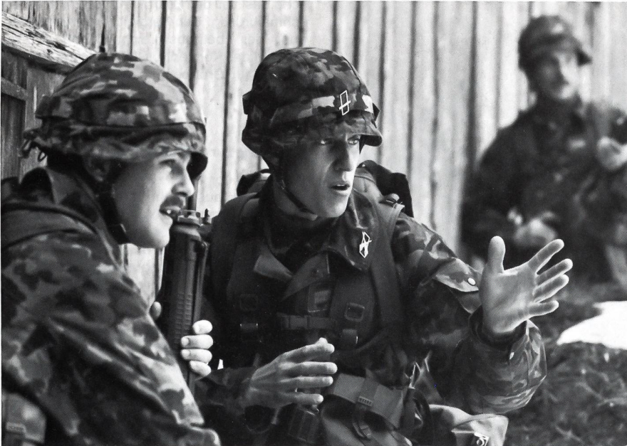
Aufbauend auf der Führungsgrundausbildung der Gruppenführer wurde auch die Führungsausbildung der Zugführer neu konzipiert.