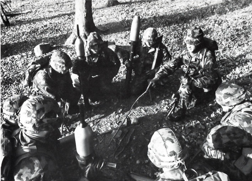
Militärische Befehlsschemata unterscheiden sich nur unwesentlich von zivilen Problemlösungskonzepten. Der Gruppenführer hat die Chance, während 12 Wochen praktischen Dienstes diese theoretischen Ansätze praktisch auszuprobieren.