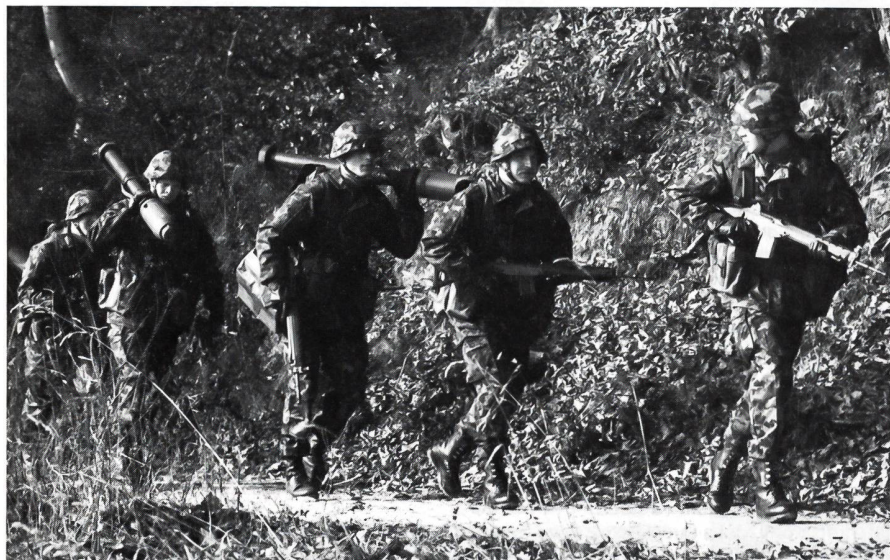
«Führungsausbildung findet immer statt» – so einer der Grundsätze der neuen Führungsgrundausbildung. Führung soll den Gruppenführern in der praktischen Anwendung und nicht im Theoriesaal vermittelt werden.

Mit der Armeereform 95 wurde auch die Führungsausbildung für die Kader der unteren Stufen neu strukturiert. Diese neue Führungsgrundausbildung (vgl Kasten) kam in den Frühjahrs-Unteroffiziersschulen 1995 bereits zur Anwendung. Im Rahmen einer Semesterarbeit an der Universität Zürich hat der Verfasser das neue Lehrmittel zur Führungsgrundausbildung der Gruppenführer im Lichte von betriebswirtschaftlichen Konzepten zur Führungskräfteentwicklung untersucht. Ein ähnliches, hier aber nicht weiter besprochenes Lehrmittel, liegt auch für Einheitsfeldweibel und Zugführer vor.