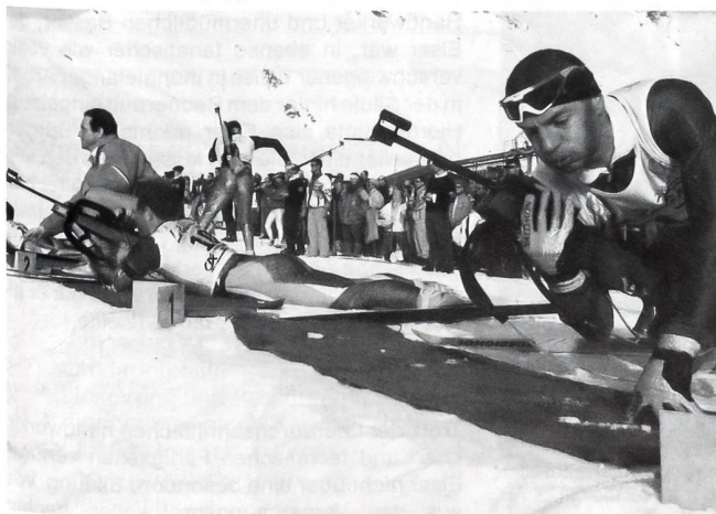
Nach den ersten 5 Kilometern «Schiessen liegend».