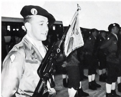
Die Parole der Gebirgsjäger von Chamonix: Chasseur un jour – chasseur toujours!