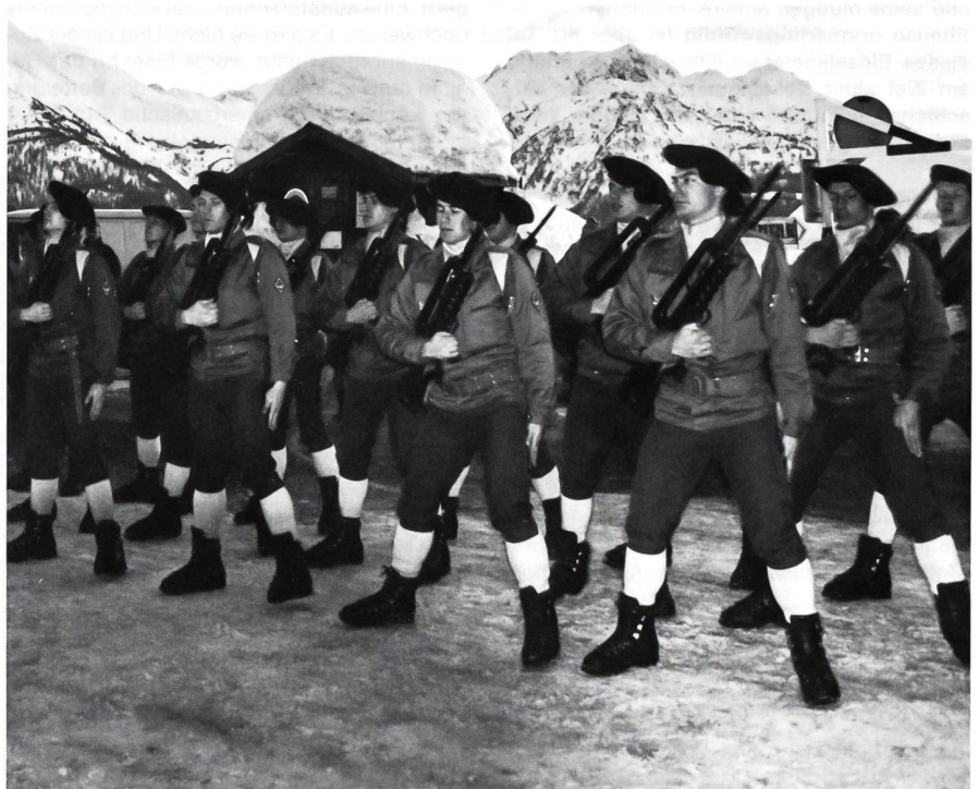
Teil der Ehrengarde bei der Rangverkündigung.