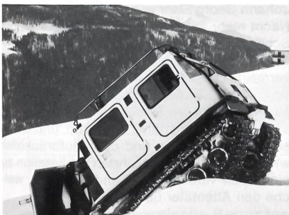
Militär-Gebirgsketten-Fahrzeug, wie eine «Katze» über Hindernisse.