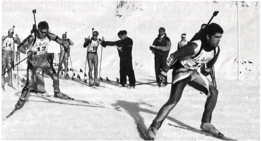
Ein kräftiger Start zum Biathlon.