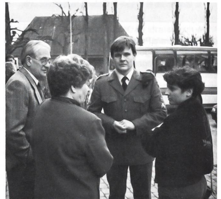
Mit einer gewissen Genugtuung und Freude wird ihr Feldweibel von der Familie begrüsst.

stellungen und Ziele mit Ihren Unterstellten zu verwirklichen. Mit einem gewissen Mass an Überwindung von Ihnen selbst und den Ihnen zur Führung Anvertrauten werden sie die kollektiven Ziele der militärischen Aufgabe erreichen. Ich wünsche Ihnen als Chef Mut, sich zu exponieren, sowie Fürsorge und Härte im richtigen Moment und vor allem Menschlichkeit im Umgang mit Ihren Unterstellten.»