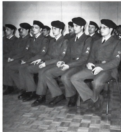
Zufrieden, den technischen Lehrgang mit Erfolg abgeschlossen zu haben.

« Sie haben hier das theoretische Rüstzeug erhalten, um dann im praktischen Dienst ihr Wissen in Taten umzusetzen. Bei ihrem Verband werden sie als Werkstattchef oder Systemspezialist erwartet und können dort das Gelernte mit Erfahrungen ergänzen und vertiefen. Selbstverwirklichung und Selbstüberwindung werden ihren Weg in die Zukunft begleiten. Als Chef werden sie besonders gefordert sein, Ihre Vor-