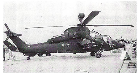
Premiere vor Publikum: Prototyp des Kampfhelikopters Eurocopter Tiger

fighter 2000 zeigte sich der Öffentlichkeit erstmals im Flug. Das von Deutschland, Grossbritannien, Spanien und Italien gemeinsam in Entwicklung stehende und politisch umstrittene Projekt wird noch dieses Jahr Schlagzeilen machen, wenn die Parlamente über den Serienbau befinden müssen. In Berlin wurde der deutsche Prototyp DA1 gezeigt, der im März 1994 seinen Erstflug unternommen hatte und bis heute rund 50 Stunden geflogen ist.