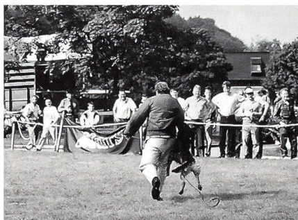
Nach dem letzten Hindernis, dem Wasserbecken, hatte der Hund gleich einen Figuranten zu packen und zu stellen.