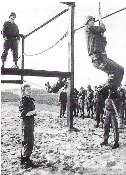
Auch eine Karriere als Sportinstructor ist möglich für Frauen bei der niederländischen Luftwaffe