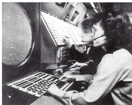
Frauen bei der Luftwaffe – immer noch eine Seltenheit

Demnächst wird die Dienstpflicht abgeschafft (inzwischen erfolgt rō). Das führt zu Bestandslücken, die aufgefüllt werden müssen. Dafür wendet sich die Luftwaffe auch intensiv an die Frauen. Die Aufklärungs- und Werbeaktionen in den letzten vier Jahren liessen den Frauenanteil vorerst nur um ein einziges Prozent steigen. Um vor 1996 zu verdoppeln und den Zielwert von 8 Prozent zu erreichen, laufen gegenwärtig interne und externe Werbeaktionen. Um das Ziel zu erreichen, müssen von den jährlichen Anstellungen 20 Pro-