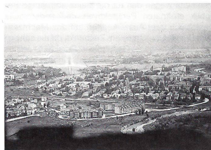
Eindrücklicher Endanflug: Zerstörte Gebäude, wo hin man blickt.

Je tiefer sich die Fokker dem Boden nähert, desto sichtbarer werden die zerstörten Häuser und Dörfer. Direkt in der Anflugschneise liegen Ruinen der einst so blühenden Stadt Sarajevo. «Da schau, es brennen wieder ein paar Lichter der Anflugbefeuerung