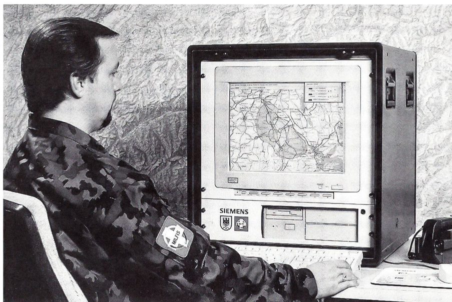
Der Arbeitsplatz «Milfis»

Das von der Gruppe Rüstung gewählte Milfis ging als Sieger aus der Evaluation mit einem nichtgenannten Konkurrenzprodukt hervor. Es ist eine modifizierte Kopie des Führungsinformationssystems Heros 2/1 der deutschen Bundeswehr, das auch in anderen europäischen Ländern mit Erfolg eingesetzt wird. Als Computersprache (Betriebssystem) hat der Hersteller des Milfis UNIX verwendet. Diese Sprache wurde Ende der 60er Jahre von Ken Thomson bei den Bell Laboratories (USA) entwickelt. UNIX eignet sich vor allem für den Mehrbenutzer-Betrieb. Sie beinhaltet ein