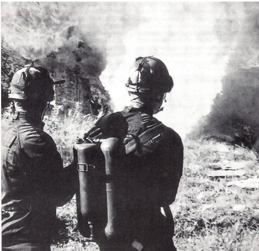
«Tir au lance – flammes pour ouvrir la voie aux fantassins.» Ausbildung der französischen Legionäre.

Militärisch auftragsorientierte Überlegungen bestimmen die Ausrüstung der Militärpolitisten und Territorial-Füsiliere mit Schlagstöcken, Handschellen und Tränengasgewehren. Die Rechtsgrundlagen von der Bundesverfassung und vom neuen Militärgesetz sind dafür eindeutig. Hier gilt es den ideologisch getragenen politischen Versuch der Schwächung unserer Soldaten im Ordnungsdienst von «links» abzublocken.