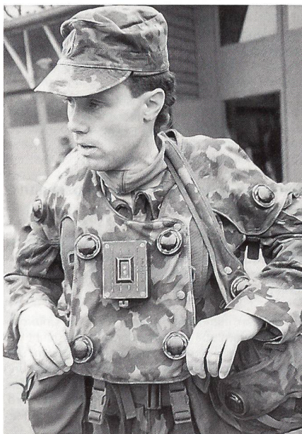
Sensoren am ganzen Körper zeigen feindliche Laserstrahlertreffer an.

Neu war der Einsatz von Stgw-Schiesssimulatoren: Jeder Kämpfer hatte auf seinem Stgw einen Laserstrahlender montiert; jeder trug auf einer Weste und auf dem Helm Sensoren, die jeden von einem gegnerischen Laserstrahl erzielten Treffer akustisch anzeigten – das penetrante Pfeifen konnte bis zum Ende der Übung nur durch Flachliegen des «Getroffenen» ausgeschaltet werden. So wirkte das Vorücken viel zeitgerechter – das einstmalige Drauflosstürmen weichte zB einem Zickzacklauf über die