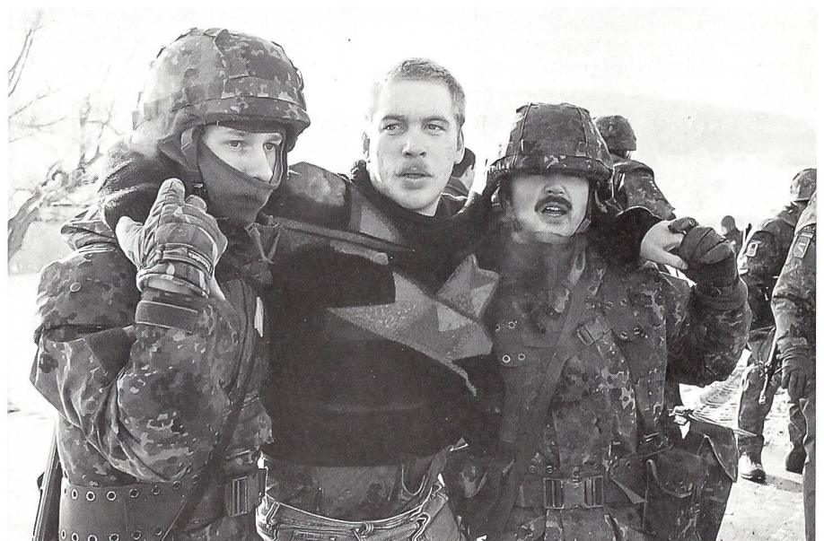
Realistische Übung im Vereinten-Nationen-(VN-)Ausbildungszentrum an der Infanterieschule der Bundeswehr in Hammelburg/Franken.

tenen Bosnien-Auftrag glücklicherweise der Fall.