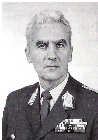
General Karl Majcen

Karl Majcen: Das Bundesheer hat als bewaffnete Macht der Republik die klare Aufgabenstellung, über die militärische Landesverteidigung hinaus die verfassungsmässigen Einrichtungen zu schützen und auf Anforderung der zivilen Behörden, zum Beispiel eines Bürgermeisters, bei aussergewöhnlichen Elementarereignissen und Unglücksfällen rasche Hilfe zu leisten. Zudem finden Einsätze im Dienst internationaler Organisationen im Ausland statt.