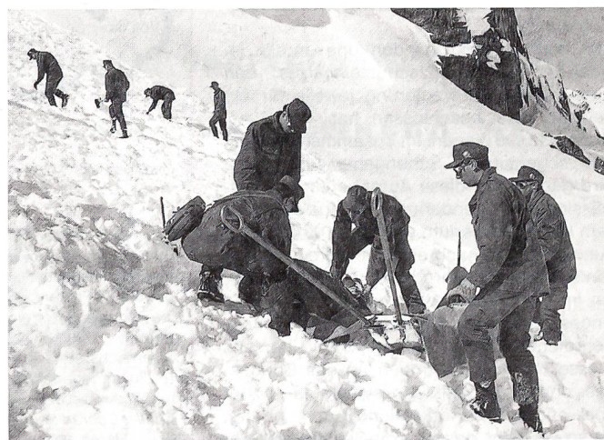
27.2.1995: Lawineneinsatz Bielerhöhe.