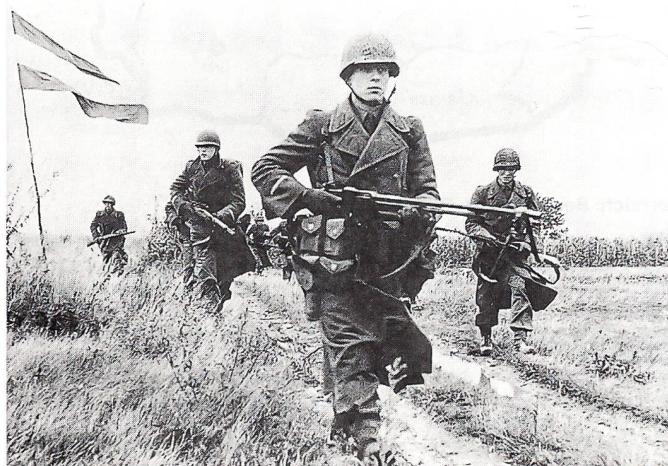
24.10.1956: Grenzeinsatz während des Volksaufstands in Ungarn.