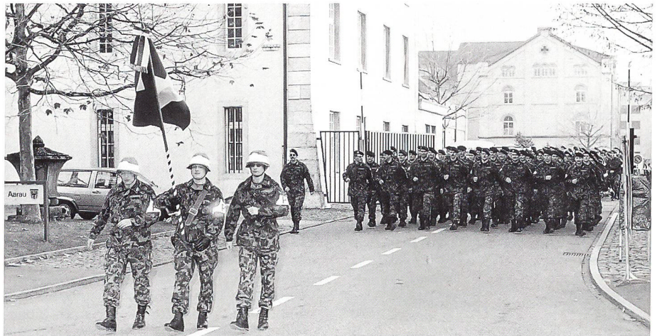
In Achterblocks, die Schweizer Fahne voran, marschierten die Offiziere des MP Bat 1, die Teilnehmer der Einführungskurse MP Of, MP Uof und Sdt sowie MP Gren von der Kaserne Aarau zur Stadtkirche. Die Tambourengruppe der Kantonspolizei Aargau stellte sicher, dass der grosse Harst von Militärpolizisten tip-top-tadellos durch die Altstadt marschierte.

Bis 1995 setzte sich die Mannschaft des MP