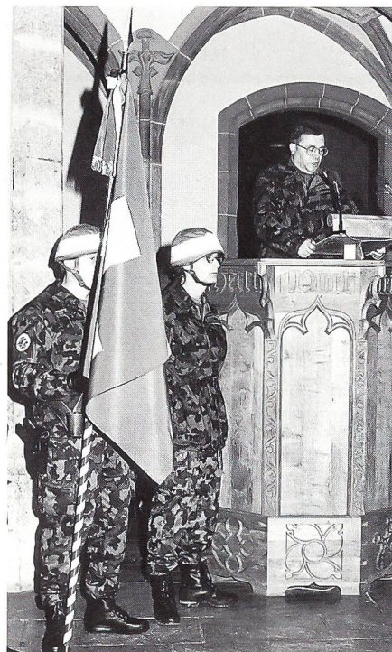
Oberst i Gst Peter Hofacher, Chef der Militärischen Sicherheit, beglückwünscht die neuen Militärpolizisten und dankt dem Stab Militärpolizei für die geleistete Arbeit.

Die zukünftigen MP Gren fürs MP Bat 1 verfügten über sämtliche Ausbildungsanlagen des Schiessplatzes «Gehren» bei Aarau. Dank hoher Motivation konnte in den wichtigen Fächern wie Personen- und Fahrzeugkontrollen, Geländedurchsuchung, waffenloser Nahkampf, Strassensperren, Objektschutz, Schiessen mit MP und Pistole unter Belastung ein respektable Ausbildungsstand erreicht werden.