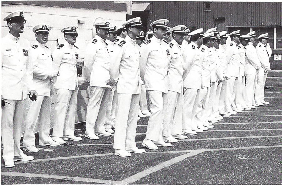
In den schmucken weissen Sommeruniformen warten die rund 30 Offiziere sowohl der «Gold»- wie der «Blue»-Crew der «USS Maine» auf dem Pier in Kittery, Maine, auf die Indienststellung ihres Bootes. Beim eigentlichen Festakt werden sie auf den Befehl «Crew, man the boat!» im Laufschrift auf das Boot eilen.