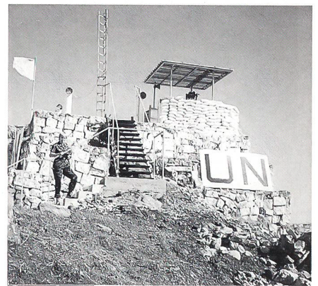
UN-Beobachterposten Group Golan Tiberias, Nov 1995

gegenüber, doch die Situation beruhigte sich wieder; wichtig in so aufregenden Momenten ist, zumindest äusserlich Ruhe zu bewahren. Eindrücklich war, wie Schwarze tagelang ohne Schuhe auf einsamen Strassen marschierten, um zu wählen, und generell die Gastfreundschaft und Herzlichkeit im Lande. Nach den Wahlen waren wir sehr befriedigt, in einer erfolgreichen Mission der UNO einen Beitrag für Demokratie, Freiheit und Unabhängigkeit in Namibia geleistet zu haben.