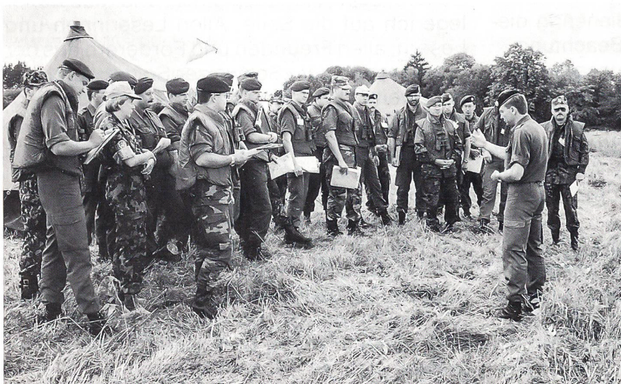
Truppenübungsplatz Allenstein, Österreich, UN-Militärbeobachterkurs UNMOC, Juli 1995: «Befehlausgabe OP-Exercise».

Schweizer Sanitätseinheit – Swiss Medical Unit (SMU), der UNTAG, Namibia 1989 (vier Monate), UNO-Militärbeobachterkurs, Österreich 1995.