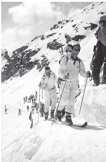
Im Aufstieg zum Col de la Chaux

Die Wettkampfstrecke ist ein Teil der Walliser Haute-Route. Die Haute-Route ist in alpinen Kreisen sehr gefragt, besonders im April bis in den Mai. Das Erleben dieses Ski- und Bergalpinismus dauert Tage oder Wochen, je nach Strecken- und Bergwahl. Es geht um ein Leben mit Ski, Fellen und Bergausrüstung auf 2500 m ü. M. und höher mit immer wieder wechselnder Hüttenunterkunft. Eine Rennstrecke in diesem hochalpinen Raum zu schaffen, bedeutet ein Riesenaufgebot an Sicherheitsvorkehrungen. Für die Ausgabe 1994