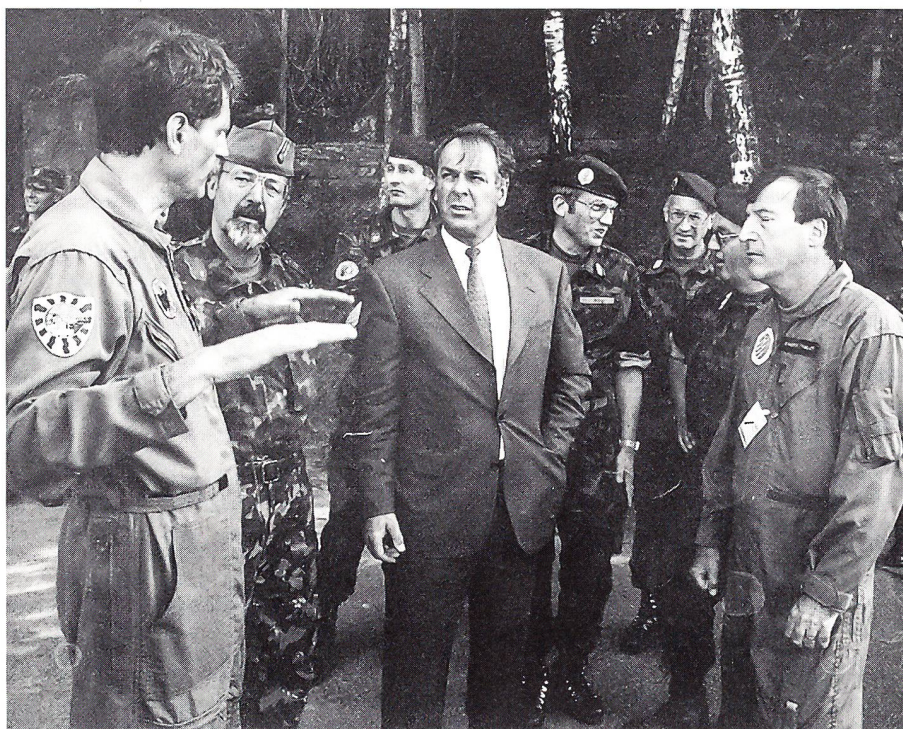
Bundesrat Adolf Ogi unterhält sich auf dem Militärflugplatz Turtmann mit der Truppe (Montag, 6. Mai 1996).

suchte er die Truppennähe, was ihm beinahe bis zur Vollkommenheit gelang. Die dort im Instruktionssdienst auf ihrem Militärflugplatz weilende Truppe, etwa 70 Offiziere und annähernd 800 Unteroffiziere und Soldaten, war zusehends erfreut über den Besuch des