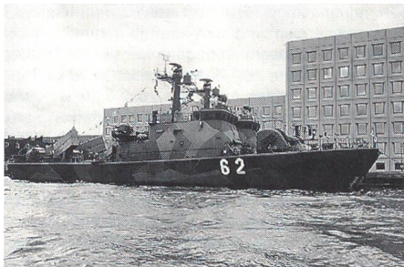
Die finnischen Schnellboote «Oulu» (62) und «Turku» (61) der «Helsinki»-Klasse

in Russland setzt China sein Bestreben fort, alte Schiffe durch qualitativ hochwertiges Material zu ersetzen. • Finnland • Auch die finnische Marine versieht seine Neuanschaffungen mit Stealth-Eigenschaften. Der Prototyp für eine Serie von bis zu acht