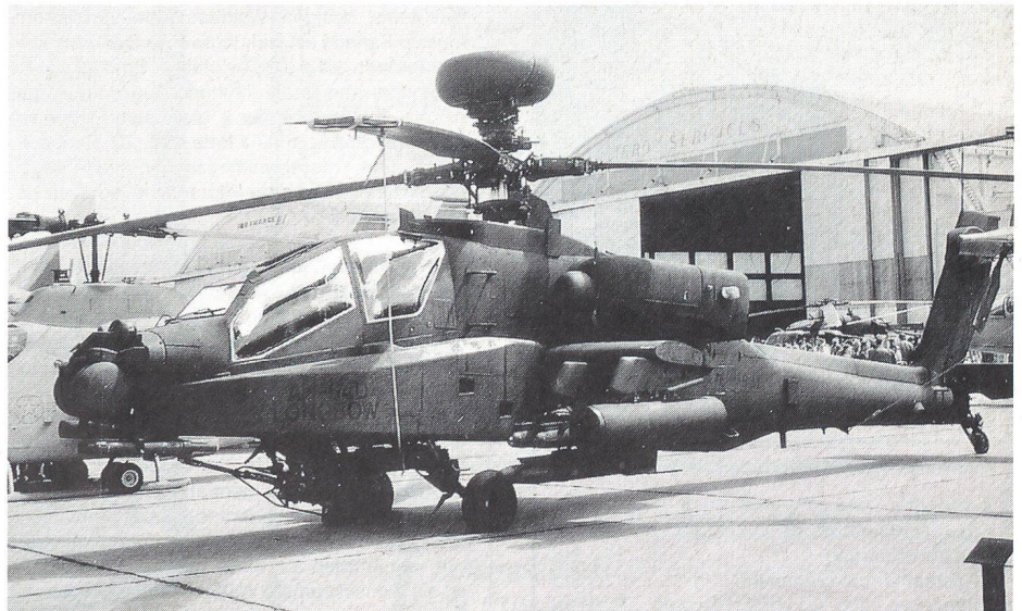
Kampfhelikopter AH-64D Apache Longbow

Nachdem am 20. Juni in Le Bourget die Verteidigungsminister von Frankreich und Deutschland den Vertrag über die Produktion und Beschaffung des Kampfhelikopters Tigre unterzeichnet haben, kann Eurocopter aufatmen. Aufgrund der Bewaffnung mit der Lenkwaffe AC3G ist der Tigre auch der verbesserten Version des AH-64 Apache von McDonnell Douglas, dem AH-64D Apache Longbow mit seiner Hellfire-Lenkwanne, überlegen. Während die französischen Heeresluftstreitkräfte bis 2010 insgesamt 80 Tigre für die Gefechtsfeldunterstützung und für die Panzerabwehr erhalten werden, sollen die deutschen Streitkräfte mit 80 Tigre ausgerüstet werden. Weitere 267 Tigre sollen bis 2025 ausgeliefert werden. Eurocopter erhofft auch von anderen Staaten Bestellungen. Der Tigre wird ab 2006 durch den Kampfhelikopter RAH-66 Comanche von Boeing und Sikorsky eine ernsthafte Konkurrenz erhalten. Dieser wird schneller, leichter und wendiger als der Apache sein und eine kleinere Silhouette aufweisen.