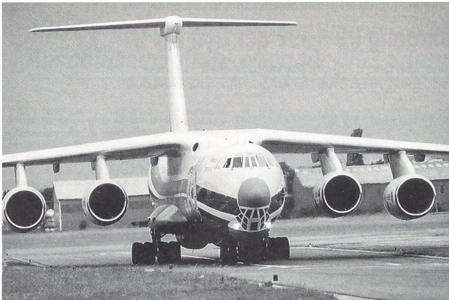
IL-76MF mit neuen Triebwerken

Vertreten war die zivile Weiterentwicklung der früher bekannten sowjetischen Transportmaschine IL-76 als IL-76MF. Ausgerüstet mit modernen Triebwerken dürfte die Leistung dieses nicht mehr neuen Flugzeuges – der Erstflug erfolgte 1971 – erheblich gesteigert sein und damit für Staaten, die sich eine Flotte von Transportflugzeugen beschaffen möchten und deren finanzielle Möglichkeiten begrenzt sind, eine interessante Alternative zu amerikanischen oder europäischen Produkten sein.