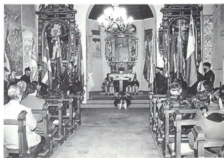
Gedenkfeier in der Sempacher Schlachtkapelle.