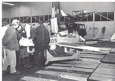
Die Aufklärungsdrohne ADS 95 «Ranger» wird von den Teilnehmern auf Herz und Nieren geprüft und begutachtet.

Die militärischen Aufgaben des Rangers umfassen die Erkundung, Aufklärung und Überwachung. Im