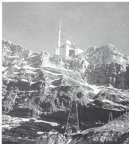
Die imposante Baustelle auf dem Säntis.

Die Bauarbeiten gestalten sich auf dieser Höhe sehr anspruchsvoll. Einerseits beeinträchtigt die Witterung die Bauarbeiten, andererseits darf der touristische Ausflugsverkehr nicht beeinträchtigt werden. Auf der Baustelle stehen drei Baukräne im Einsatz.