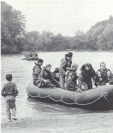
Erste Etappe gut überstanden. Landung in Altreu.

nehmen. Sehr schnell mussten die Ruderer feststellen, dass die Wasserströmung weit geringer als erwartet war, was natürlich hiess, statt sich gemütlich treiben zu lassen, kräftig rudern! Auf halbem Weg gab es nach 2 1/2 Stunden harter Arbeit bei der Halbinsel Altreu den ersehnten Zwischenhalt. Dort wurden die Teilnehmer mit einer vorzüglichen Paella, zubereitet von der «Chaotenküche» Grenchen, verwöhnt, und auch zur Pflege der Kameradschaft blieb noch genügend Zeit.