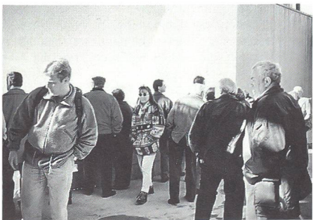
Die Grossbaustelle wird von den Teilnehmern eingehend begutachtet.

Der diesjährige gesellschaftliche Anlass des UOV Andelfingen führte in die Ostschweiz auf den St. Galler Hausberg Säntis. Nachdem die Reisegesellschaft am frühen Morgen das neblige Weinland verlassen hatte, führte die Fahrt über Gossau und